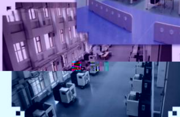
DMG 数控技术训练场所